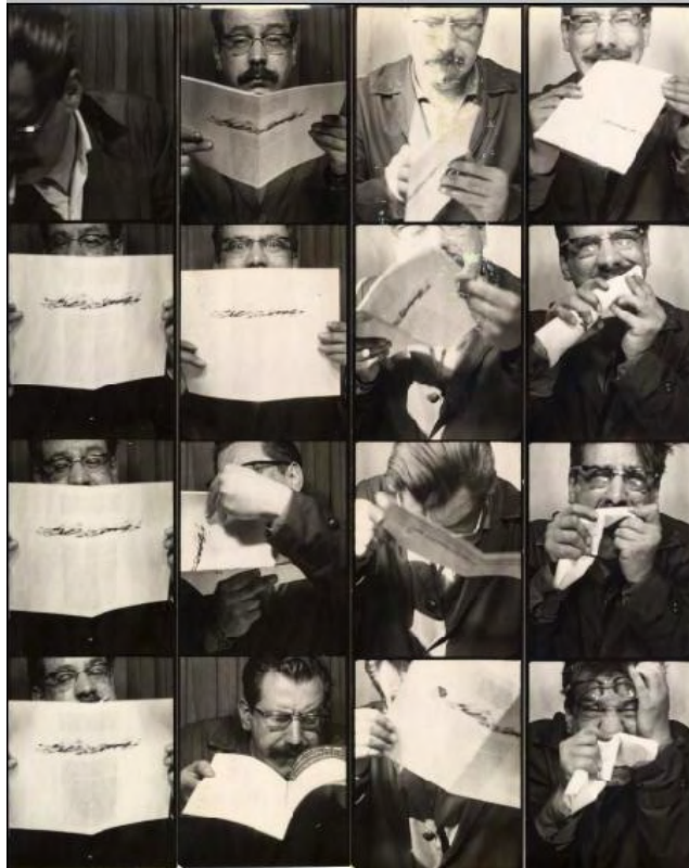
Christian Dotremont humant et dévorant le n° 1 de sa petite revue Strates

formes, stratégies et réseaux au XX e siècle